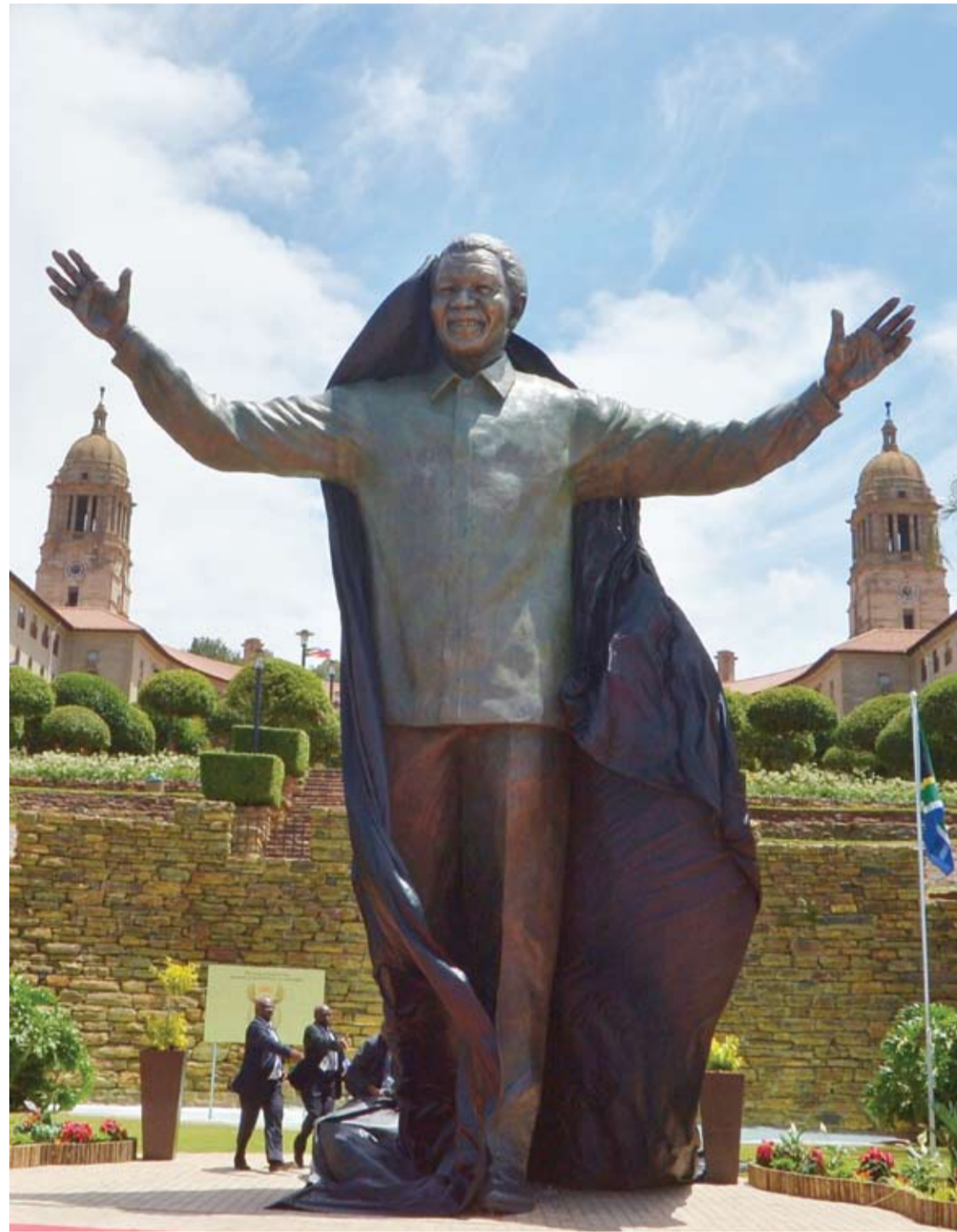
كشف النقاب عن تمثال من البرونز يبلغ طوله 9 أمتار للزعيم الجنوب أفريقي الراحل ورمز النضال ضد العنصرية نيلسون مانديلا أمام مقر الحكومة في بريتوريا.

كشفت نتائج بحث جديد أجراه علماء من جامعة واشنطن على أن الحليب العضوي (المأخوذ من أبقار تغذت على أعلاف عضوية وتعيش في ظروف بيئية نظيفة) يحتوي على تناسب أفضل بين مجموعتي الأحماض الدهنية أوميغا 3 وأوميغا 6 المفيدة للدورة الدموية. ويحت العلماء حوالي 400 نموذج من الحليب العضوي والتقليدي وكتفوا أن نسبة الحموض الدهنية أوميغا 6 وأوميغا 3 في الحليب التقليدي تبلغ 5 : 8 في حين يبلغ هذا المؤشر في الحليب العضوي 2 : 3 ما يعد أفضل لصحة الإنسان. وقال الباحث من جامعة واشنطن دونالد ديفيس إن هذه الظاهرة قد تكون متعلقة بوهم قديم حول دور الحموض الدهنية أوميغا 6 في جسم الإنسان.